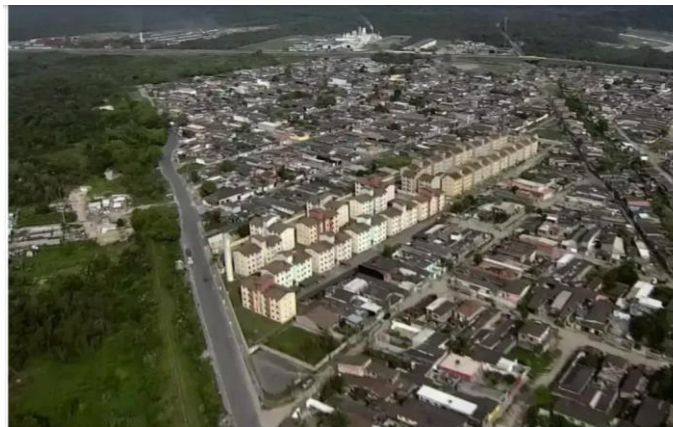
Prefeitura de São Vicente acrescenta: além do desconto no IPTU à vista, oferece regularização de dívidas.

A Secretaria da Fazenda de São Vicente informa que o desconto oferecido a quem optar pelo pagamento do IPTU à vista é de 5%, com vencimento no dia 8 de janeiro.