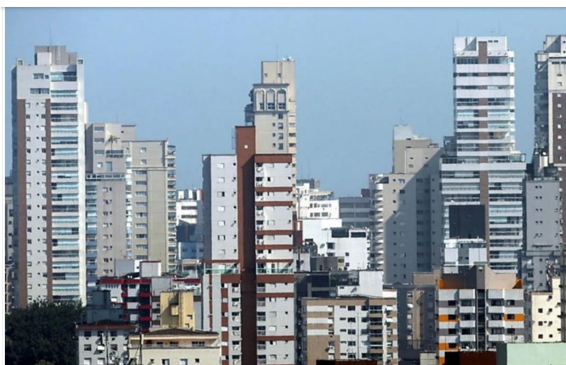
Pagamento do IPTU costuma ser feito nos primeiros meses do ano.

Com 2024 se aproximando, contribuintes passam a se preocupar com o pagamento do Imposto Predial e Territorial Urbano (IPTU). A quitação pode ser feita em cota única, normalmente no início do ano, ou em parcelas. Caso o contribuinte opte por pagar à vista, prefeituras oferecem desconto.