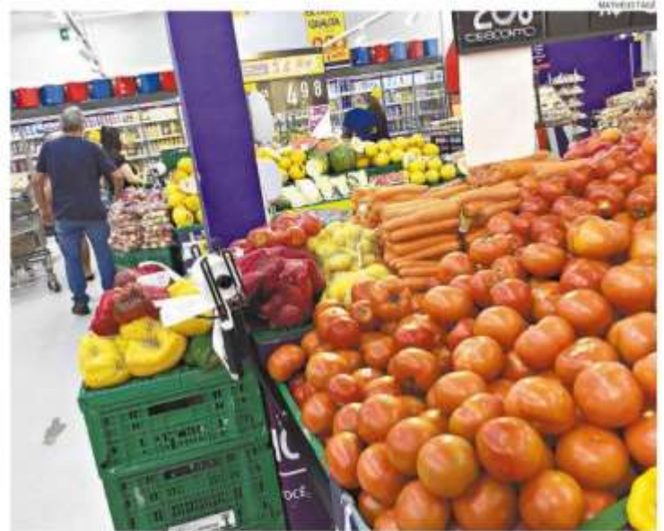
Tomate, com alta superior a 23%, foi o vilão do mês de julho, em Santos, segundo o levantamento

Com base nesse valor, o Labores apurou que seriam necessárias 94,2 horas de trabalho (de uma jornada mensal de 220 horas) para adquirir os 13 itens básicos que compõe essa cesta, projetada para uma pessoa sobreviver durante um mês. Antes da quarentena, a cesta comprometia 37,5% do salário-mínimo e 82,4 horas de trabalho.