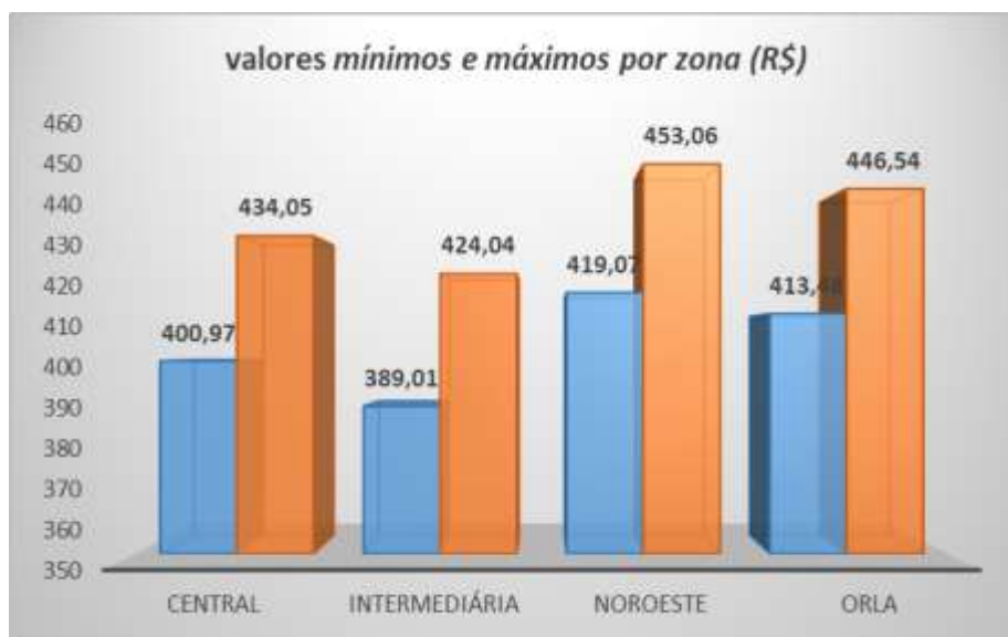
Gráfico2- Comparativo dos valores mínimos e máximos por zona (R$)