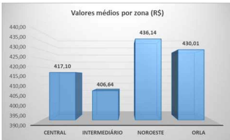
Gráfico1 - Valores médios por zona (R$)