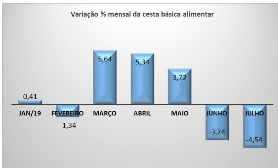
Gráfico 5 - Evolução dos valores percentuais da Cesta Básica (%)