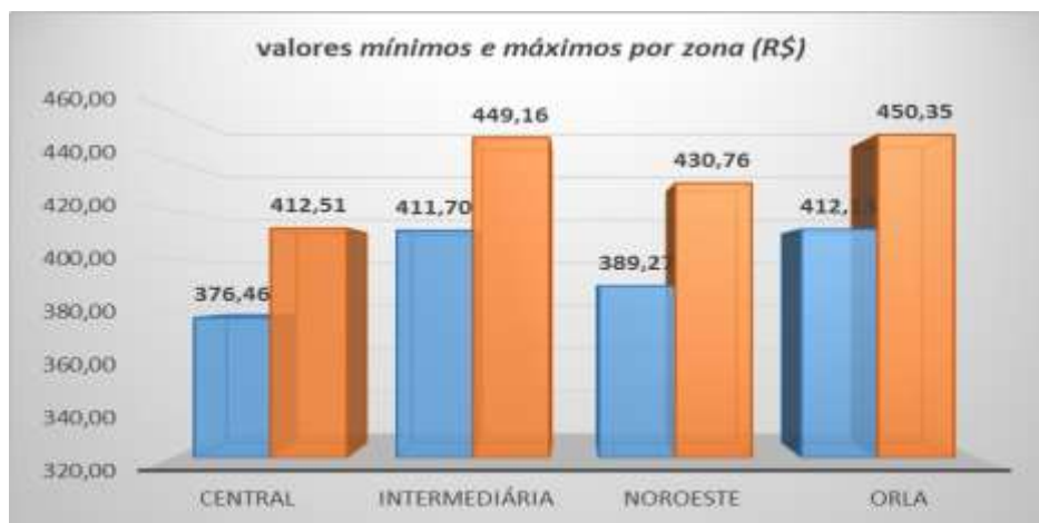
Gráfico2- Comparativo dos valores mínimos e máximos por zona (R$)