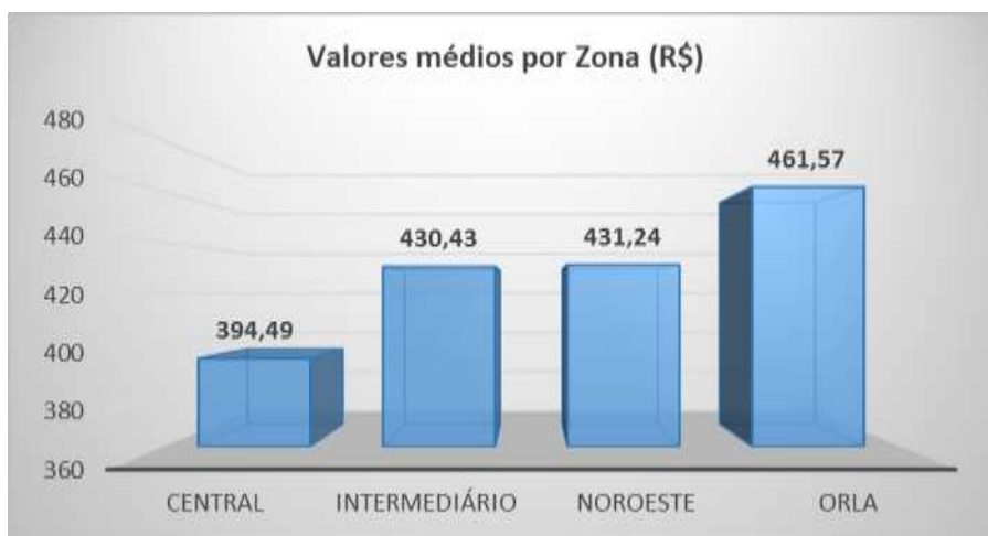
Gráfico1 - Valores médios por zona (R$)