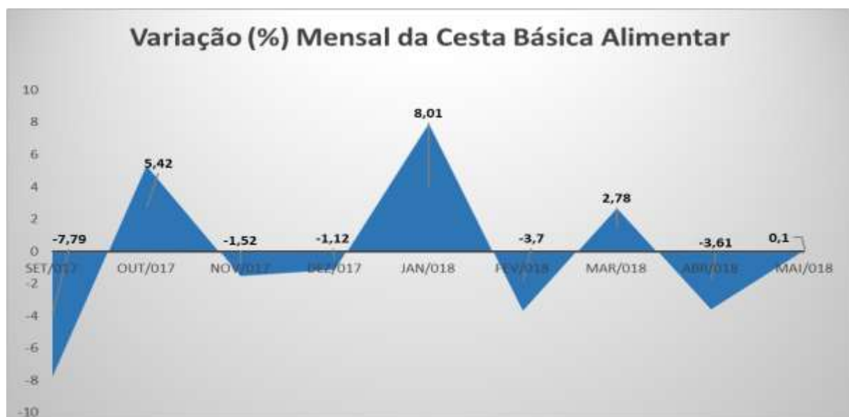
Gráfico 2 - Evolução dos valores percentuais da Cesta Básica (R$)