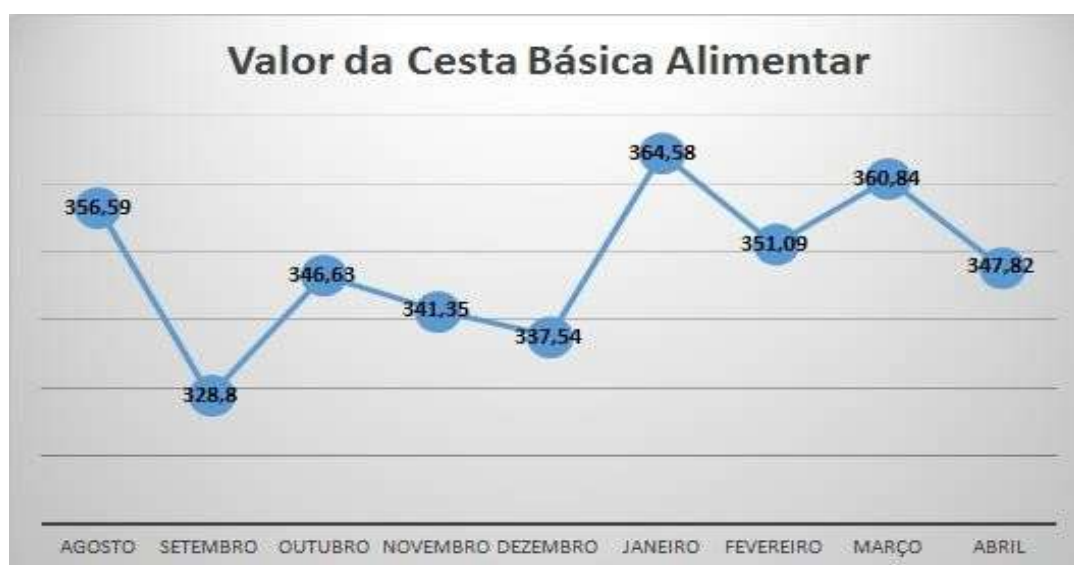
Gráfico1 - Evolução dos valores médios da Cesta Básica (R$)