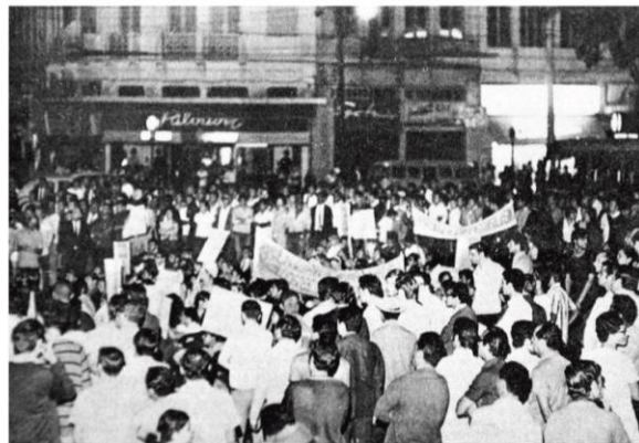
... e motivou a ditadura a, naquela mesma noite, proibir atos do gênero no Brasil; o regime endureceria