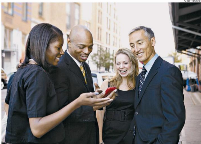
99Folks utiliza GPS para identificar pessoas próximas. Basta ter o app no celular e transferir o contato