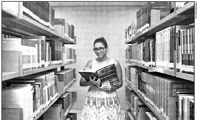
Marry entrou em contato com a secretaria da Esags, disse que não teria o valor integral e ganhou uma forcinha

Ainda não decidiu qual financiamento fazer? Então veja no quadro ao lado as facilidades que cada universidade da Baixada oferece.