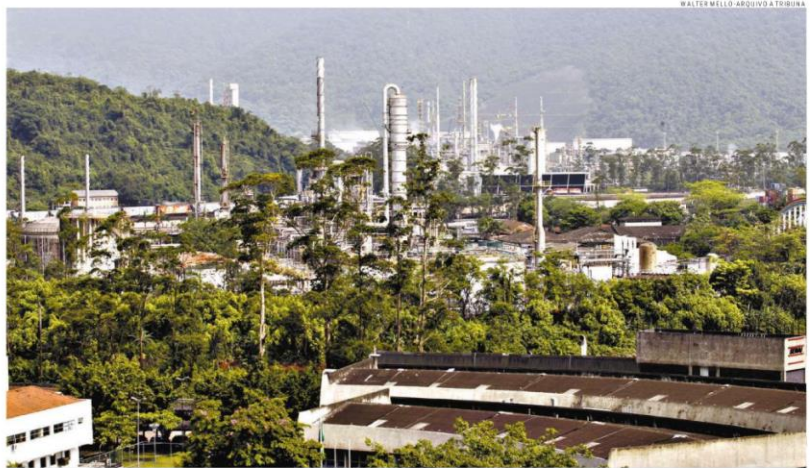
Desligamentos no polo de Cubatão e a desilusão com o pré-sal foram fatores apontados por especialistas para a continuidade da retração